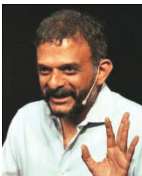
The Ramon Magsaysay awardee said the IT Rules, 2021, as the new regulations are commonly called, impose "arbitrary, vague, disproportionate, and unreasonable" restrictions on digital and social media intermediaries

The Madras High Court (HC) on Thursday asked the Centre to respond within three weeks to a writ petition filed by Carnatic vocalist T M Krishna, who moved the HC against the recently notified Information Technology (Guidelines For Intermediaries And Digital Media Ethics Code) Rules, 2021.